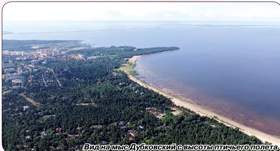
Вид на мыс Дубковский с высоты птичьего полета